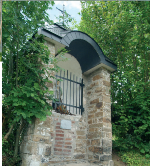
Chapelle de St Jean de Népomucène

Chapelle reconstruite et consacrée en 1734 dont le linteau de la porte d'entrée porte les armes des