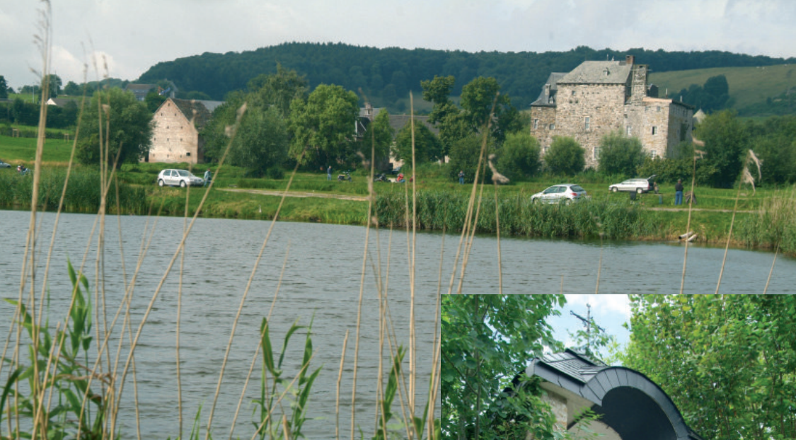
Château de Graaf